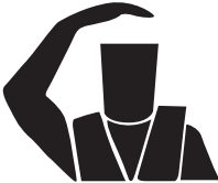
Reresa al muelle