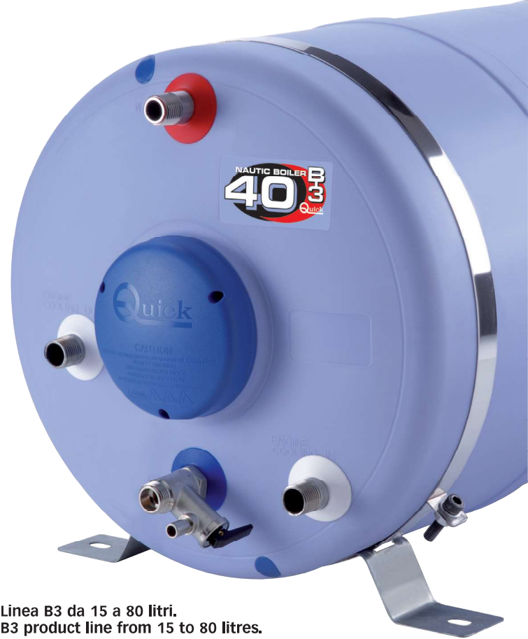
Linea B3 da 15 a 80 litri. B3 product line from 15 to 80 litres.