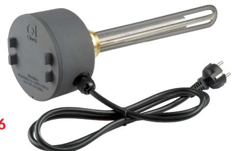
Protezione antideflagrante. / Anti-flare protection